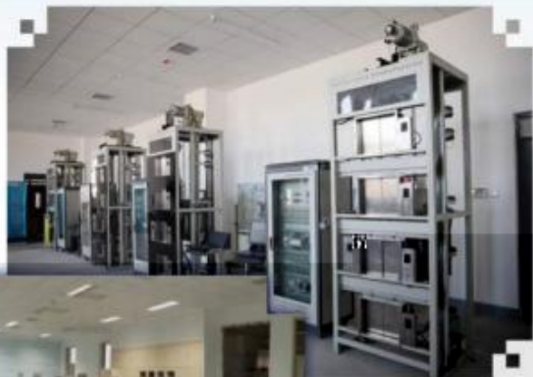
智能电梯安装调试 维护训练场所